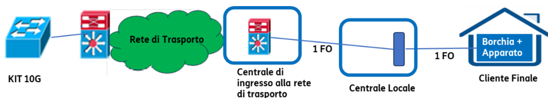
Figura 2: Schema impiantistico FTTO per velocità a 2 Gbps, 5 Gbps e a 10 Gbps con KIT base a 10G