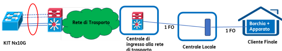
Figura 2.1: Schema impiantistico FTTO per velocità a 2 Gbps, 5 Gbps e a 10 Gbps con KIT Nx10G (porte a 10G logicamente affasciate)