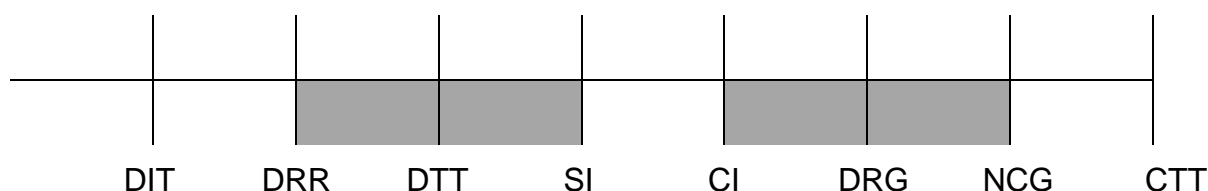
Figura 8: Tempi per il ripristino del servizio

La rappresentazione grafica del tempo di assurance per i TT di disservizio sul quale Telecom Italia basa il processo di ripristino è evidenziata con la fascia in grigio nella seguente Figura